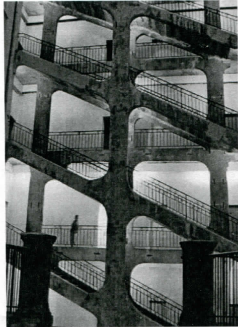
La cour des Voraces à la Croix-Rousse. Cette «traboule» aurait servi de refuge aux ouvriers canuts lors de leurs insurrections de 1848-1849.